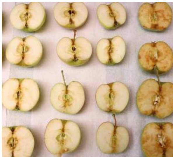
شکل ۲: سمت چپ سیب‌های تراریخته مقاوم به اکسیداسیون و قهوه‌ای شدن، سمت راست سیب‌های غیر

با وجود تمامی مزایا و نگرانی‌هایی که در مورد گیاهان تراریخته وجود دارد، تولید و مصرف این محصولات در سال‌های اخیر در سطح دنیا به سرعت رو به رشد بوده و بخش بزرگی از تجارت در حوزه کشاورزی را به خود اختصاص داده است.