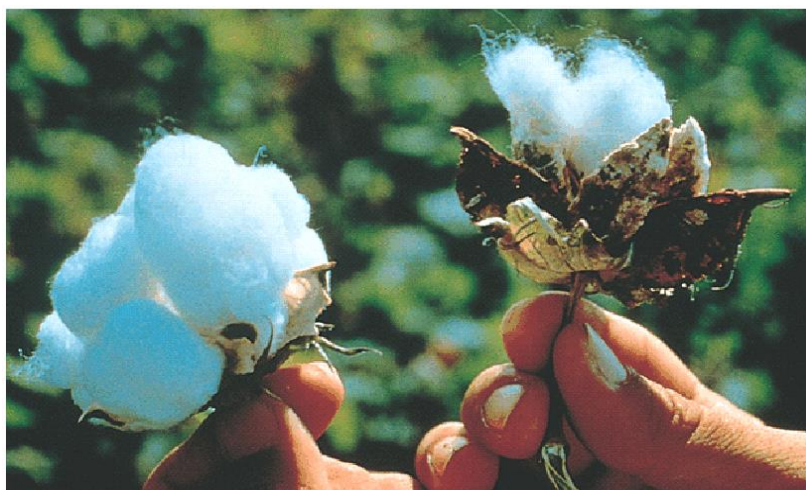
شکل ۴: سمت چپ پنبه مقام به آفات، سمت راست پنبه غیر تراریخته

"زکوی و توحیدفر، مروری بر جنبه های اقتصاد جهانی و تجاری محصولات تراریخته "