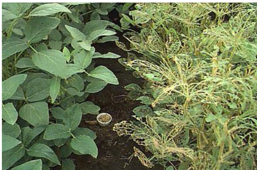
شکل ۱: سمت چپ سویای مقاوم به آفات، سمت راست سویای غیرتراریخته (۲۰۱۴ isaaa)

"زکوی و توحیدفر، مروری بر جنبه های اقتصاد جهانی و تجاری محصولات تراریخته "