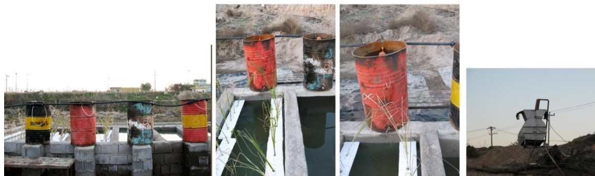
شکل (۱): نمایی از سامانه‌های تالاب مصنوعی احداث شده در محوطه کارخانه کشت و صنعت نیشکر کارون

کشت و صنعت نیشکر با استفاده از سیستم تالابی شناور (Floating wetland system) شش حوضچه با مشخصات یکسان، در محیط باز ساخته شد. هر حوضچه با ابعاد سه متر طول، یک متر عرض و ۰/۸ متر ارتفاع بر روی زمین با استفاده از مصالح بنایی (بلوک سیمانی) ساخته شد. برای ایزوله نمودن سامانه‌ها، از ملات ماسه و سیمان نرم خوب مال‌کشی شده استفاده شد. در سه عدد از حوضچه‌ها، گیاه وتیور به صورت شناور کشت شد و برای مقایسه این سامانه‌ها با سامانه‌های فاقد گیاه، سه حوضچه بعدی بعنوان شاهد (بدون گیاه) در نظر