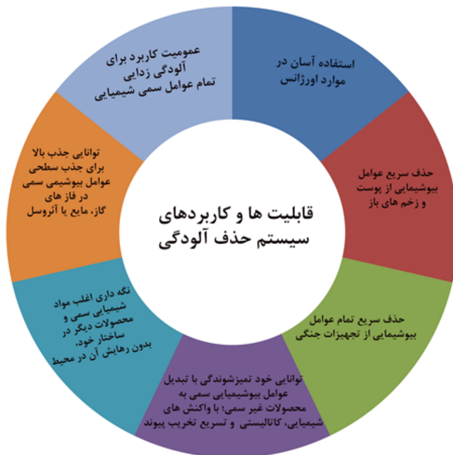
شکل ۲- شرایط کاربردی از سیستم آلودگی زدایی برای اندازه گیری مقابل مواد شیمیایی سمی و عوامل شیمیایی زیستی.

(Oerlikon Neumag Austria GmbH) در آزمایشگاه بافندگی و مواد پیشرفته در دپارتمان سلامت انسان و محیط در دانشگاه تگزاس تک صورت گرفت (۳۹). ویپ کامپوزیت (composite wipe) طراحی شد تا بازده پاکسازی بالا، جذب عالی مواد سمی مایع، جذب ویژه بخارهای سمی و توانایی نگهداری بالا به