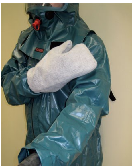
شکل ۴- کیت آلودگی‌زدایی غیربافتی خشک.