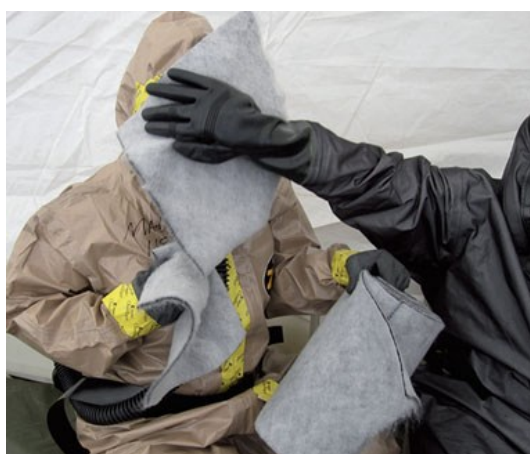
شکل ۳- ویپ آلودگی‌زدای غیربافتی خشک

دست آید. ارزیابی انجام‌شده توسط آزمایشگاه‌های لونس و لیورمر نشان داد که توانایی نگهداری بخارات خردل توسط ویپ دیکون (Decon wipe) بهتر از ذره کربن و فناوری آلودگی‌زدای جاذب M291 است (۲۳). از دیدگاه لجستیکی،