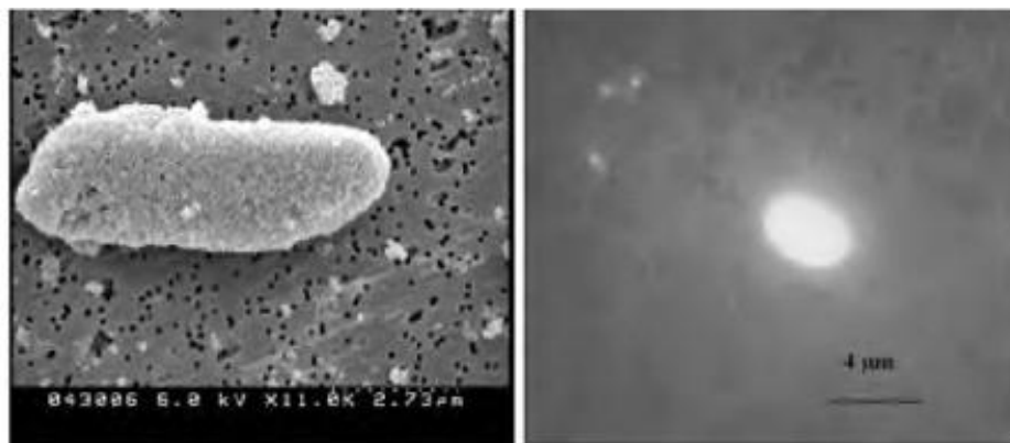
شکل ۲- میکروگرام الکترونی یک باکتری E.coli (چپ) و فلورسانس یک تک سلول باکتریایی بدنبال گرم‌خانه‌گذاری با آنتی‌بادی نانوذرات کانژوگه شده (راست) (۱).

این نوع اندازه‌گیری نوری می‌تواند علایم تشخیص را تشدید کند. گستره‌ای از آزمون‌های پیوند لیگاند و ایمونو برای تشخیص و اندازه‌گیری مولکول‌های کوچک نظیر ویتامین‌های محلول در آب و آلاینده‌های شیمیایی (بقایای دارویی) نظیر سولفونامیدها و بتا‌آگونیست‌ها برای استفاده همراه با سیستم‌های حسگر مبتنی بر SPR گسترش یافته‌اند که بیشتر از آزمون‌های الایزا یا سایر آزمون‌های ایمونولوژیکی موجود منتج شده‌اند. اگرچه مراحل اولیه توسعه در فناوری حسگرهای زیستی در حوزه بیوشیمی صورت گرفت، توانایی تشخیص، آنالیز و کمیت‌سنجی مولکول‌ها با منشا زیستی متفاوت و ناهمگونی در مبنای سنجش، موجب خلق طرح‌های