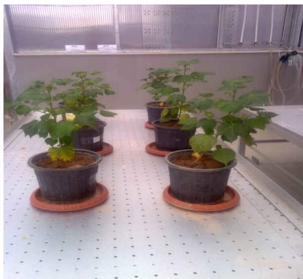
شکل ۱. کشت و نگهداری پنبه تراریخته (سمت راست) و شاهد غیر تراریخته (سمت چپ) در گلخانه تراریخته

جمعیت در رایزوسفر و بالک برای گیاه تراریخته و شاهد یکسان بود (شکل ۲).