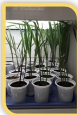
۴- استفاده از هورمون جهت افزایش وزن پدازک و رشد رویشی