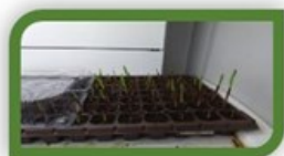
۵- سازگاری و رفع خواب در شرایط گلخانه