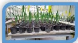
۶- گذراندن دوبار دوره رویشی