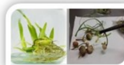
۲- بهینه‌سازی کشت بافت