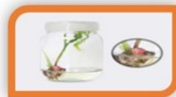
۳- افزایش سایز

شکل ۲- مراحل تولید پدازه تجاری با استفاده از فناوری کشت بافت.