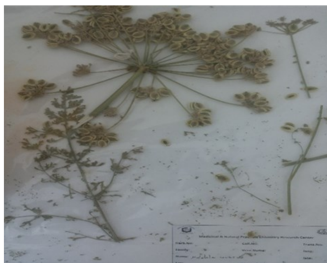
شکل ۱- تصویر گیاه M. secacul

هدف از این مطالعه، شناسایی اجزای اسانس، همچنین تعیین درصد ترکیبات تشکیل‌دهنده اسانس اندام هوایی گیاه M. secacul جمع‌آوری شده از استان فارس و در مرحله بعد بررسی اثرات ضد میکروبی آن روی چند سویه از باکتری‌های گرم مثبت و منفی است.