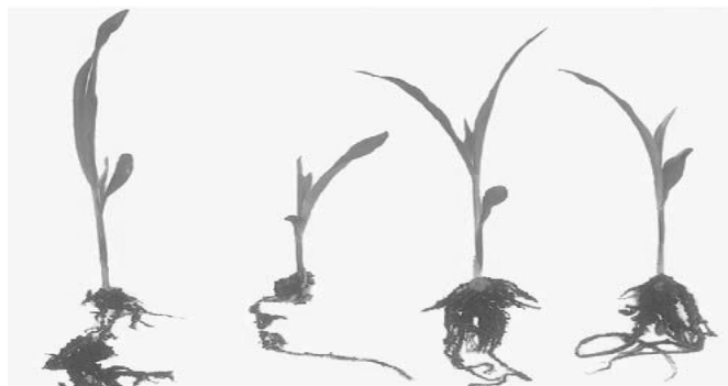
شکل ۱- اثر تلقیح باکتری در کنترل بیمارگر فوزاریومی و افزایش رشد گیاه میزبان (۲) تلقیح با علامت + و عدم تلقیح با علامت - نشان داده شده است

دلیل به عنوان یکی از عوامل موثر در فرایند پالایش زیستی خاک‌های آلوده به ترکیبات هیدروکربنی، یا سایر ترکیبات شیمیایی از جمله علف کش‌ها و حشره کش‌های باقی مانده در محیط هستند که به عنوان