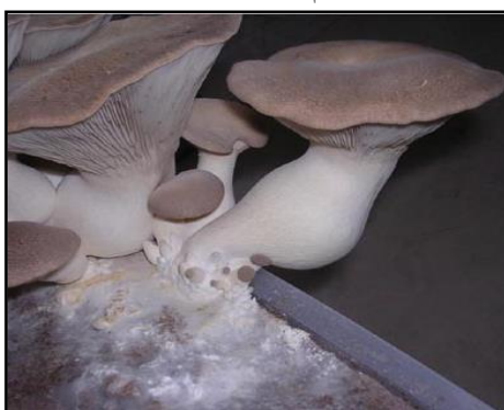
شکل ۳- اندام باردهی متعلق به پلوروتوس/اوستراتوس

باردهی، تفاوت قابل توجه در محتوای این ترکیبات در میان گونه‌ها و نژادهای این جنس را تأیید می‌کنند. پژوهشگران برای اندام باردهی زیر تقسیماتی شامل ساقه (Stem) و کلاهک (Pilei) قائل شدند و اعلام کردند که در ساقه این گونه از قارچ‌ها، فیبرهای غیرمحلول و بتاگلوکان بیشتری نسبت به کلاهک وجود دارد (۱۶) (شکل ۳).