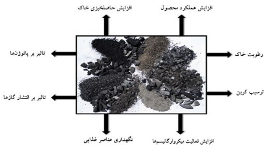
شکل ۲- اثرات بیوچار در خاک

"افراشته و کولیوند، اثر زغال زیستی (بیوچار) در افزایش مقاومت گیاهان نسبت به عوامل بیماری‌زا"