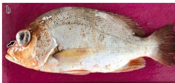
شکل ۱- علائمی از اثرات عامل باکتریایی ویبریوز در ماهی هامور ( Epinephelus lanceolatus ). تصویر راست) کاهش فلس‌ها و آگزوفتالمی (علامت پیکان). تصویر چپ) کاهش فلس و زخم‌های پوستی روی بدن ماهی (Manchanayake et al. 2023)