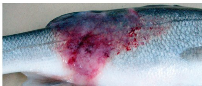
سی‌باس ( Dicentrarchus labrax )

جدول ۳- تصاویری از تاثیر عوامل باکتریایی میکوباکتریوم بر بدن و اندام‌های درونی ماهی قزل‌آلای رنگین کمان، گلدفیش و سی‌باس. (Passantino et al. 2008; DPIRD. 2013; Avsever et al. 2016; Delghandi et al. 2020)