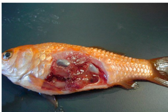
گلدفیش ( Carassius auratus )