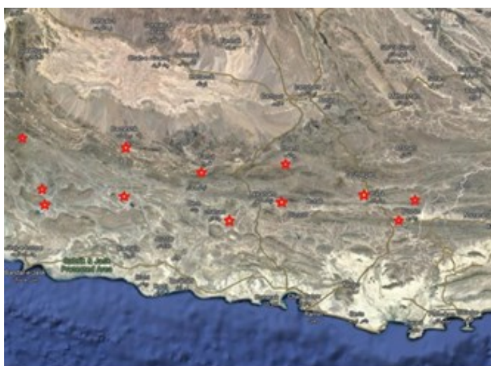
شکل ۱- الف: پراکندگی جغرافیایی رویشگاه‌های اصلی M. peregrina در جنوب ایران (Keneshloo, 2015)، ب: تصویر درخت بالغ M. peregrina