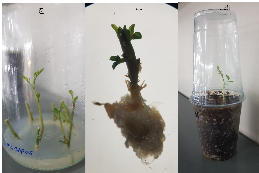
شکل ۳ الف. باززایی مستقیم گیاهچه از گره ساقه، ب. باززایی غیرمستقیم شاخساره از کالوس، ج. سازگار سازی گیاه باززا شده در شرایط اتاقک رشد، گیاه M. peregrina .

برای سازگاری گیاهچه‌های ریشه‌دار شده، ۲۵ بوته با ریشه‌های توسعه یافته (از آزمایش ریشه‌زایی) پس از شستشوی کامل با آب مقطر استریل، به گلدان حاوی خاک استریل منتقل شدند. سازگار سازی گیاهچه‌ها با برداشتن تدریجی عایق روی آنها انجام شد و در نهایت نرخ بقای بالایی (۹۰ درصد) ثبت شد (شکل ۳ ج).