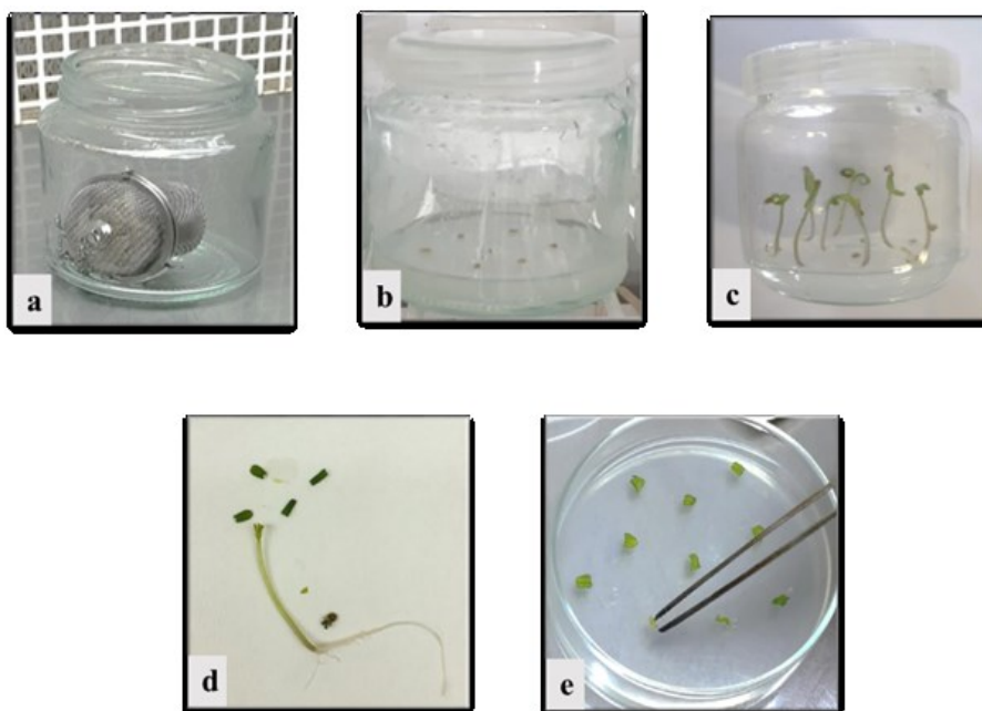
شکل ۱- مراحل تهیه و کشت ریزنمونه‌ها، (a) ضدعفونی کردن بذرها، (b) کشت بذرها در محیط ½MS، (c) ظهور لپه‌های ۱۰ روزه، (d) برش ریزنمونه‌ها، (e) کشت ریزنمونه‌ها در محیط باززایی.

بعد از گذشت ۶ هفته از زمان کشت، داده‌برداری از تعداد نوساقه در هر پلیت (۱۲) ریزنمونه در هر پلیت) انجام شد. برای بدست آوردن میانگین تعداد نوساقه‌ها در هر ریزنمونه، اعداد به دست آمده تقسیم بر عدد ۱۲ شدند.